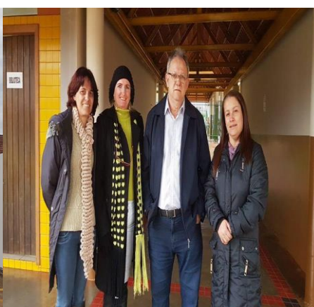
Visita ao Colégio Estadual Ivone Soares Castanhari, localizado no Jardim Tropical.