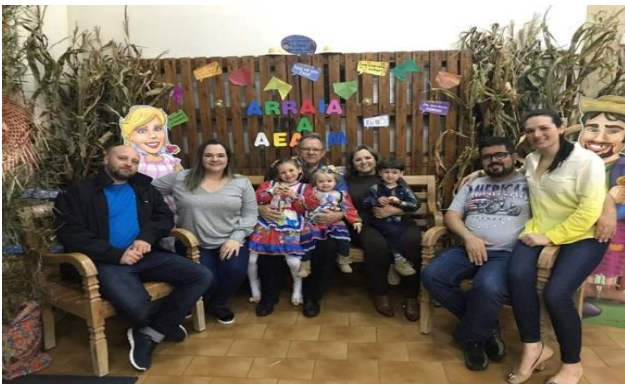
Participando da Festa Julina da Associação dos Engenheiros Agrônomos de Campo Mourão.