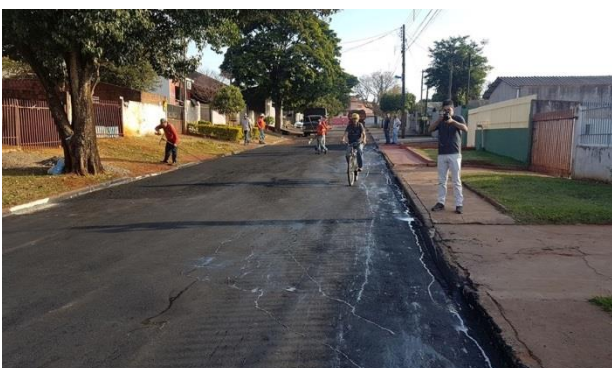
Fiscalizando o Recape asfáltico no Jardim Alvorada, em execução pela CODUSA.