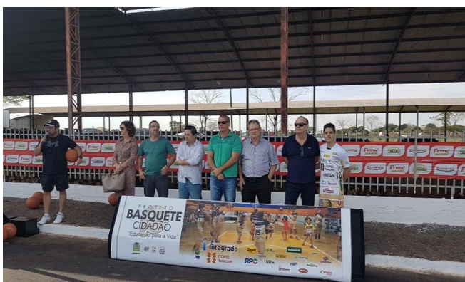
Entrega de tabelas de basquete, adquiridas pela “Amo basquete”, com recursos obtidos através da Justiça Federal. As tabelas serão cedidas às escolas que desenvolvem o Projeto Basquete Cidadão.