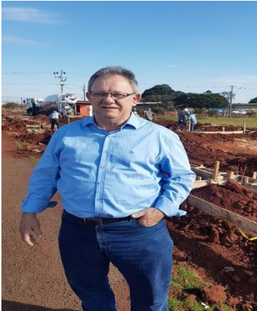
Fiscalizando a obras na Praça da Juventude, região do Jardim Aeroporto.