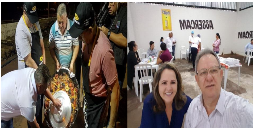
Prestigiando a Festa Nacional do Carneiro no Buraco. Barraca da ASSERCAM.