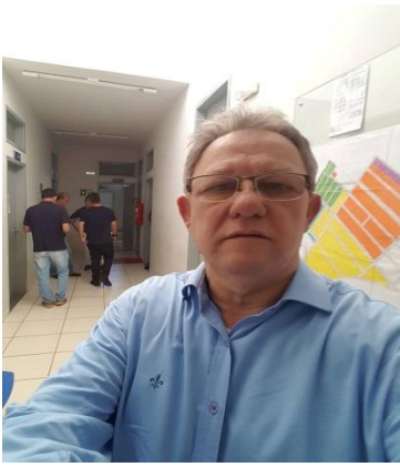
Visita à Unidade Básica de Saúde do residencial Avelino Piacentini.