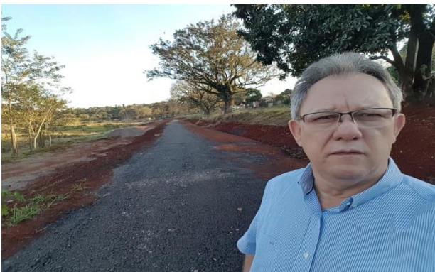
Fiscalizando a obras no Parque das Torres, região dos Jardins Cidade Nova e Alvorada.