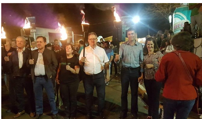
Ritual do fogo da Festa Nacional do Carneiro no Buraco, Campo Mourão Pr. Após um cortejo, de aproximadamente 400 metros, com tochas acesas, às 23 horas os buracos são acesos e às 5 horas da manhã os tachos são baixados nos buracos.