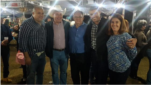
Participando da Festa Julina do Jardim Araucária.