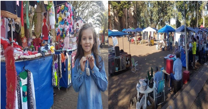
Prestigiando a Feira da Economia Criativa, realizada todos os domingos das 9 às 18 horas na Praça São José.